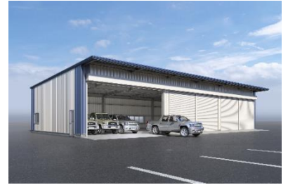
車庫・農業用倉庫